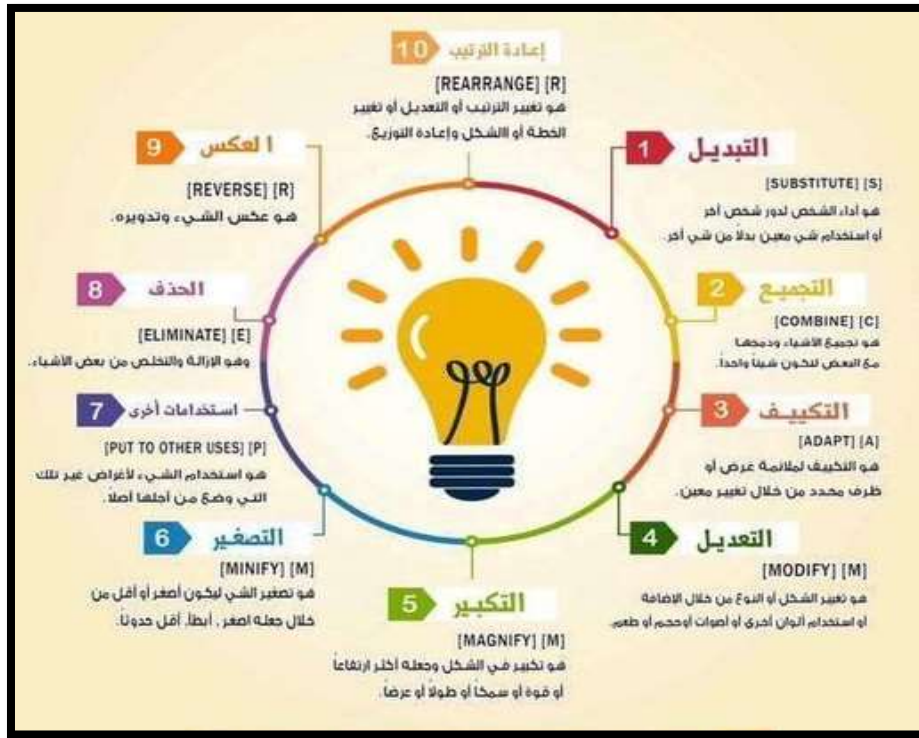
الشكل (4): أدوات سكامبر (SCAMPER)

فاعلية برنامج سكامبر "SCAMPER" التعليمي في تنمية القدرات الإبداعية لدى أطفال الروضة..... م.د. إيمان يونس إبراهيم