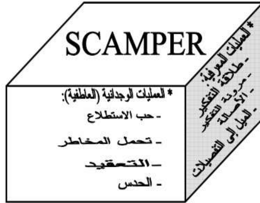
الشكل (3) انموذج سكامبر (SCAMPER) (Eberle.B,1996)

إن كلمة سكامبر (SCAMPER) وتعني اصطلاحاً (الانطلاق، أو الجري، أو العدو بمرح)، كما إن كل حرف من الحروف السبعة يشير إلى الحرف الأول من الكلمات أو المهارات التي تشكل في مجملها (قائمة توليد الأفكار) سكامبر SCAMPER وهي كالآتي: